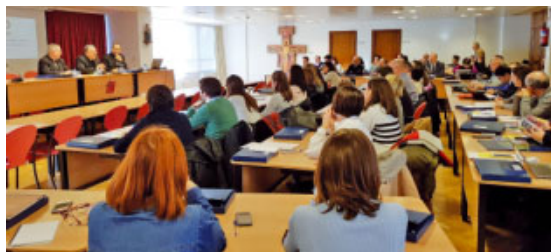
Asamblea de delegats de MCS