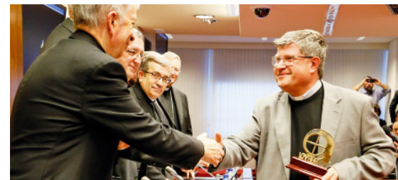
Premis Bravo 2018

Les delegats de Mitjans de Comunicació de les diòcesis espanyoles es van reunir en assemblea entre els dies 21 i el 23 de gener a Madrid, per rebre formació i compartir les situacions que viuen les diferents diòcesis a nivell informatiu, sota el títol «Aspectes imprescindibles per a la comunicació de l'Església avui».